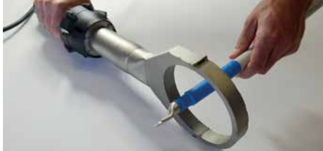
ELECTRON ST 用途多样, 其中之一就是电缆 线束的热收缩。